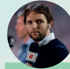
Rodrigo Fárez Youtuber Deportivo